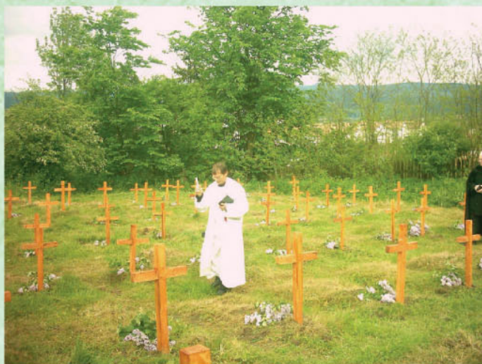
Szöveg és fotó: Czirják Károly

Az említett napon több meghívott jelenlétében a helyi római katolikus és református papok ünnepélyes keretek között újból, megáldották a temetőt, majd koszorúkat helyeztek el az újonnan felavatott kopjafa tövébe.