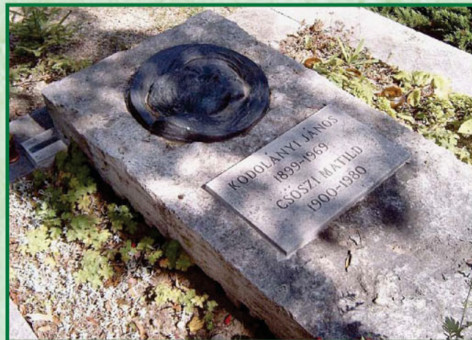
Szöveg és fotó: Puskás Béla

Életrajzi munkáin kívül sajtó alá rendezte Szív és pohár c. tanulmánykötetét. Ennek megjelenését már nem érthette meg. A Finn Köztársaság a Finn Oroszlánrend lovagkeresztjével tüntette ki (1967). A második Nyugat-nemzedék egyik kiemelkedő prózaírója volt. Műveinek és a róla szóló irodalomnak 1960-ig terjedő legteljesebb bibliográfiáját tartalmazza Varga Rózsa–Patyi Sándor munkája.