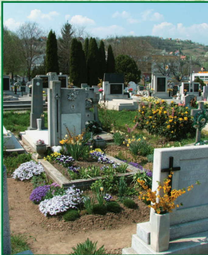
Tavasz a székszárdi temetőben