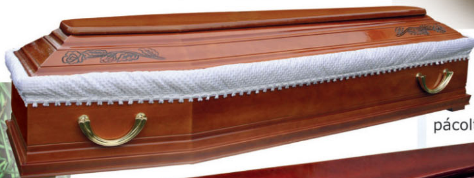
R9 bükk, pácolt cseresznye