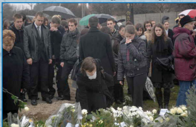
A sirt a fájdalom és a kegyelet virágai borították be.