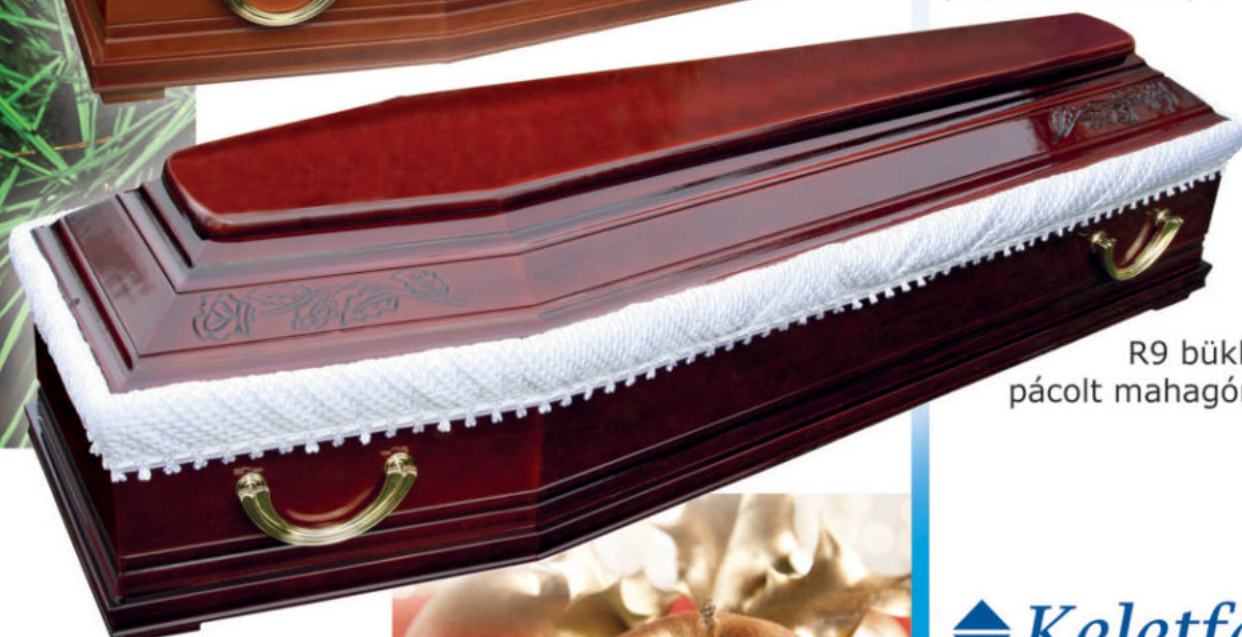
R9 bükk, pácolt mahagóni